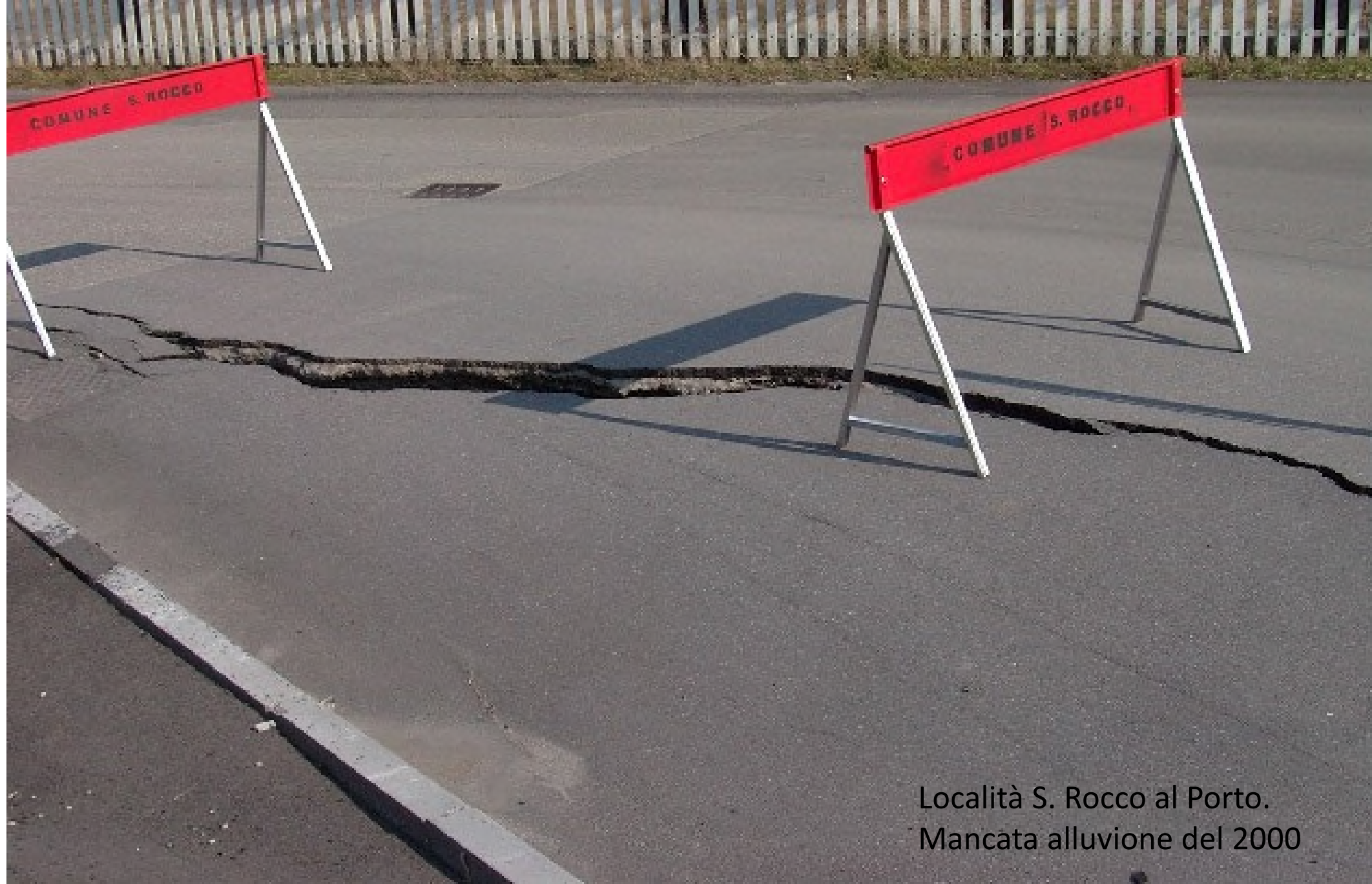
Località S. Rocco al Porto. Mancata alluvione del 2000

Cedimento di una strada. Sotto l'asfalto si è formato il vuoto e l'asfalto ha ceduto