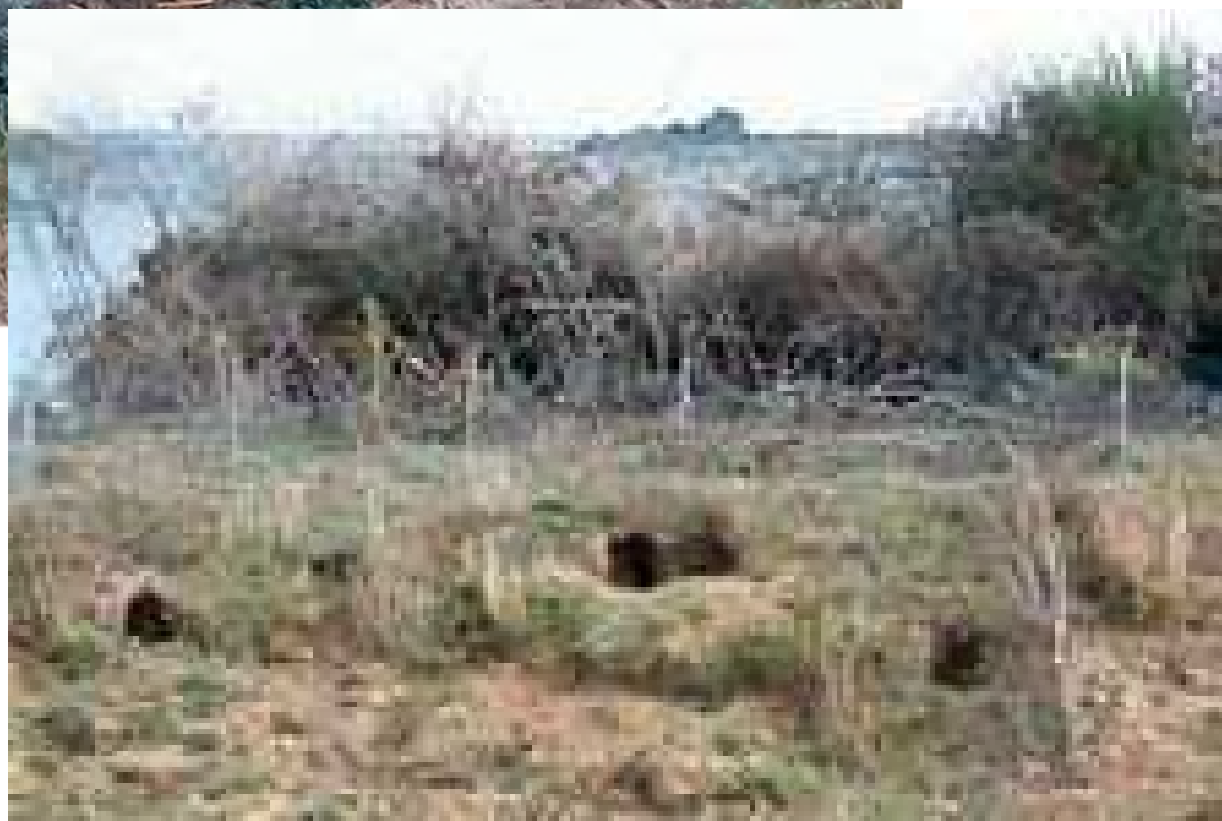
Tane di conigli selvatici