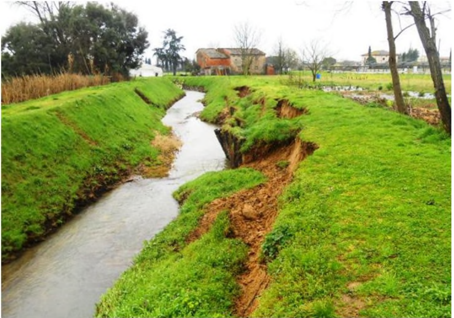
Smottamento di una riva causato dalle nutrie