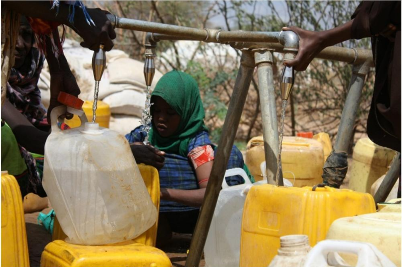
Tapstand IFO Camp, Dadaab (Oxfam 2012)

Ai rifugiati dovrebbero essere distribuiti almeno 15 litri di acqua di qualità accettabile al giorno.