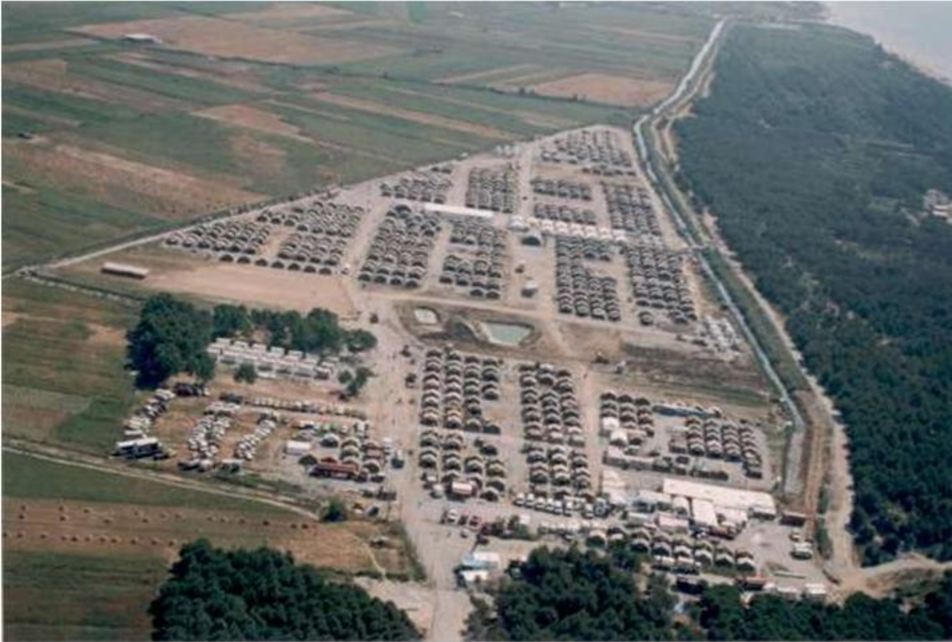
Campo Kavaje – Albania 1999 – 6500 sfollati