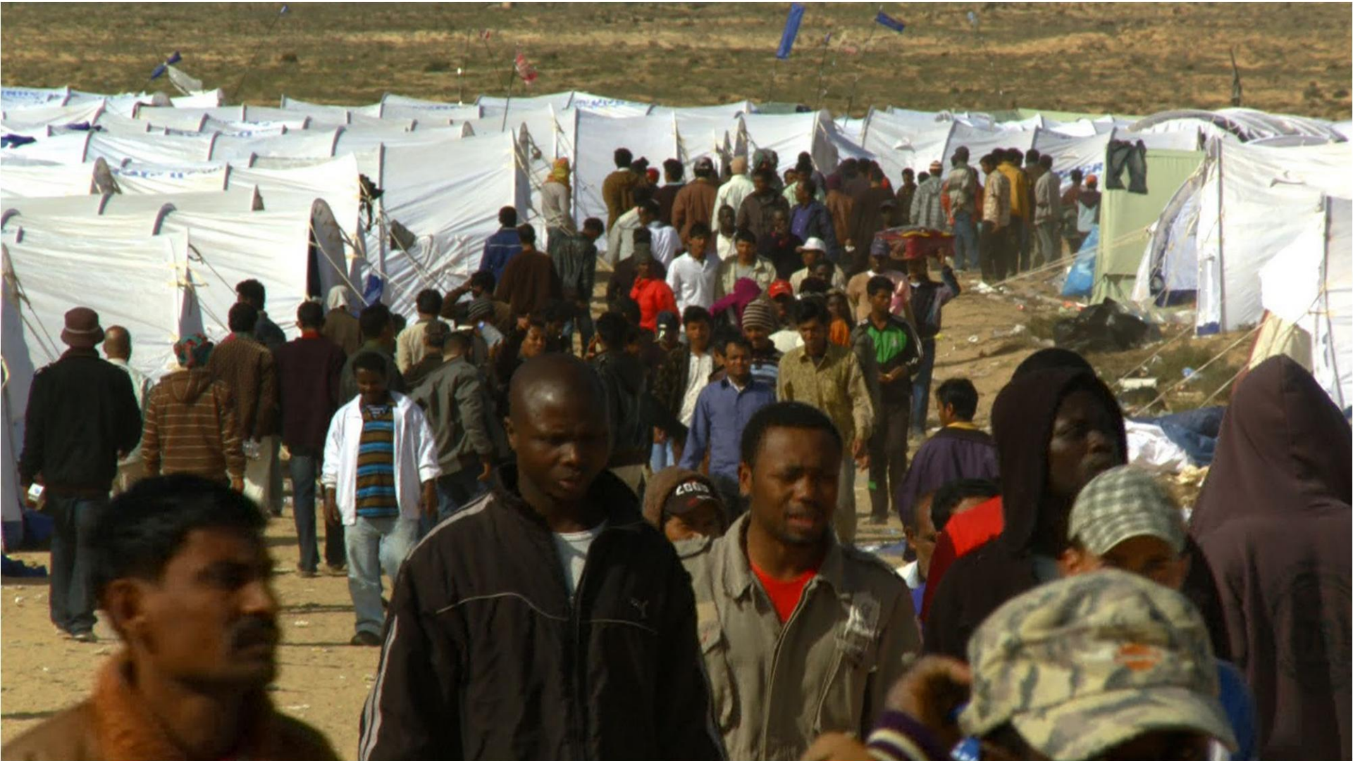
Campo UNHCR – Chochua – Tunisia 2011

Gli obiettivi principali per chi allestisce e gestisce un campo o un centro di accoglienza sono: “soddisfare le necessità primarie degli ospiti e salvaguardare la dignità della persona” .